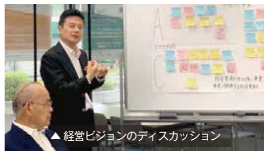
▲ 経営ビジョンのディスカッション

③ 多様な働き方支援 2017年女性活躍推進 企業認定「えるぼし」3段 目（3つ星）認定、全従