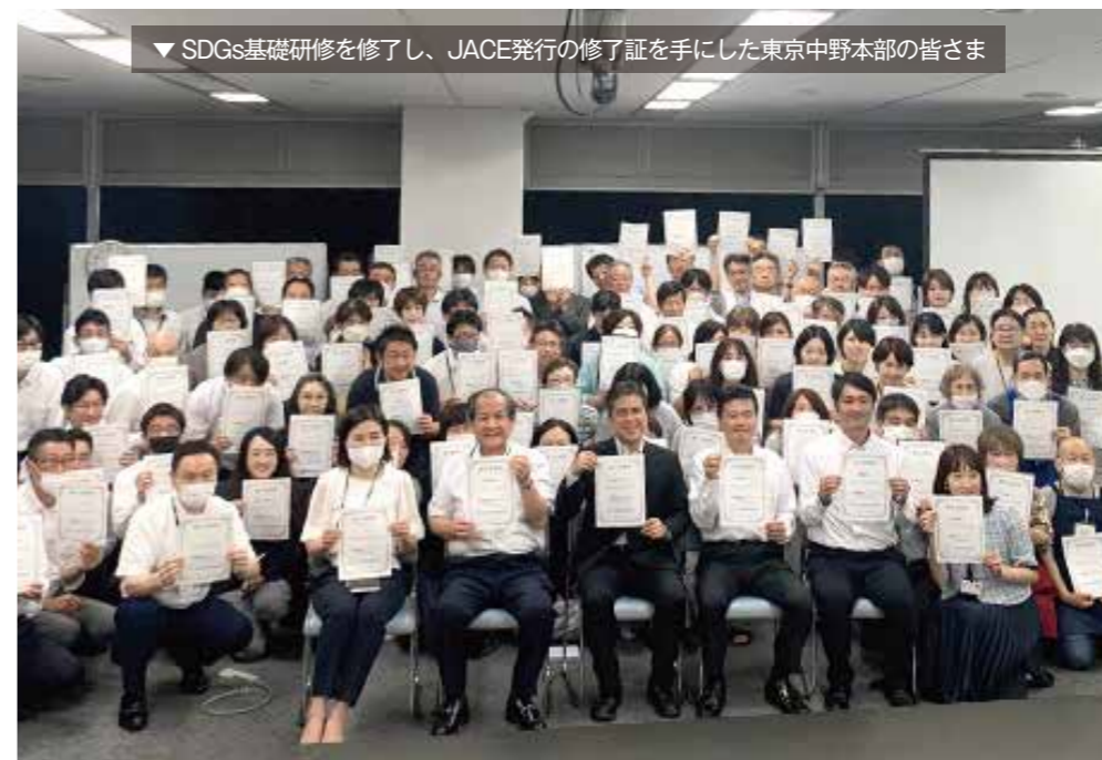
▼ SDGs基礎研修を修了し、JACE発行の修了証を手にした東京中野本部の皆さま

⑥ ESD事業活動 LEECは、SDGs宣言のもと、 ESD事業活動を通して世界のサ ステナビリティに貢献しよう との思いを表明しています。ESD とは「持続可能な社会の創り手 を育む教育」を指しています。 この考え方は、国連サミットに