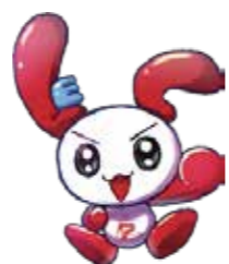
LECキャラクター “レックン”