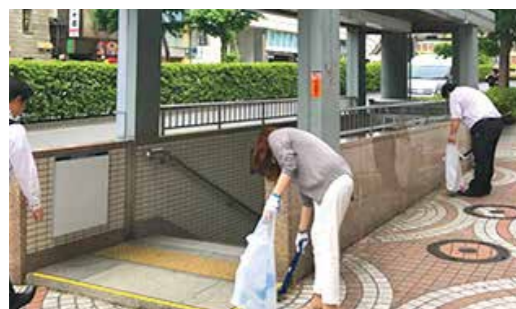
▲ 社員による清掃活動

⑤ 環境への取り組み 業員に占める女性社員の割合40 %以上、管理職に占める女性社 員の割合30%以上など、女性が 活躍している会社であることも に、2008年子育てサポート 企業「くるみん」認定、男性社 員の育休取得率71%など、性別 問わず働きやすい文化創りを目 指しています。