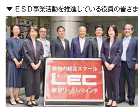
▼ ESD事業活動を推進している役員の皆さま

においてSDGsが掲げられた2 015年より10年以上遡る20 02年に実施された「持続可能 な開発に関する世界首脳会議」 において日本政府とNGOが共 同提唱したものであり、以降は ユネスコを主導機関として国際 的に取り組まれています。 同社は使命として「AI時代 において倫理と知的創造を担う 人財の育成と、人類の持続的な 繁栄に貢献する経営管理者の養 成」を掲げており、今後は一層 のESD推進に向け、社会人教 育や組織人材育成を行う「ES D事業部」を設置し、積極的に 取り組む姿勢を示しています。