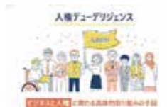
▲ ESD 関連講座例