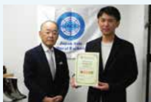
2025年10月、東邦レマックはJACEより「SDGs 活動認証」を受けました。写真は授賞式のもの。

この度頂戴した SDGs 活動認証に期待することは「企業・ブランドの社会的信用が国内外で高まり、持続可能な活動の象徴となるとともに企業・自治体・国際機関との価値観の共有が進み、新たな協働や共創の可能性が広がる」ということです。認定後のビジネスプランとして、未来を紡ぐブランド「KINRUN」が新しい価値の創造に貢献し、感動のクリエイションが市場を活性化させる契機になれば良いと思います。持続可能性を文化とした日本の美が世界に広がる努力を積み重ねたいと思います。「日本の美、世界を歩く」を今後ともよろしく願いいたします。