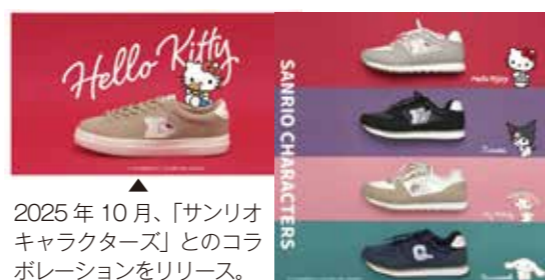
2025年10月、「サンリオキャラクターズ」とのコラボレーションをリリース。